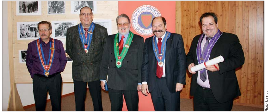
Le nouveau comité.